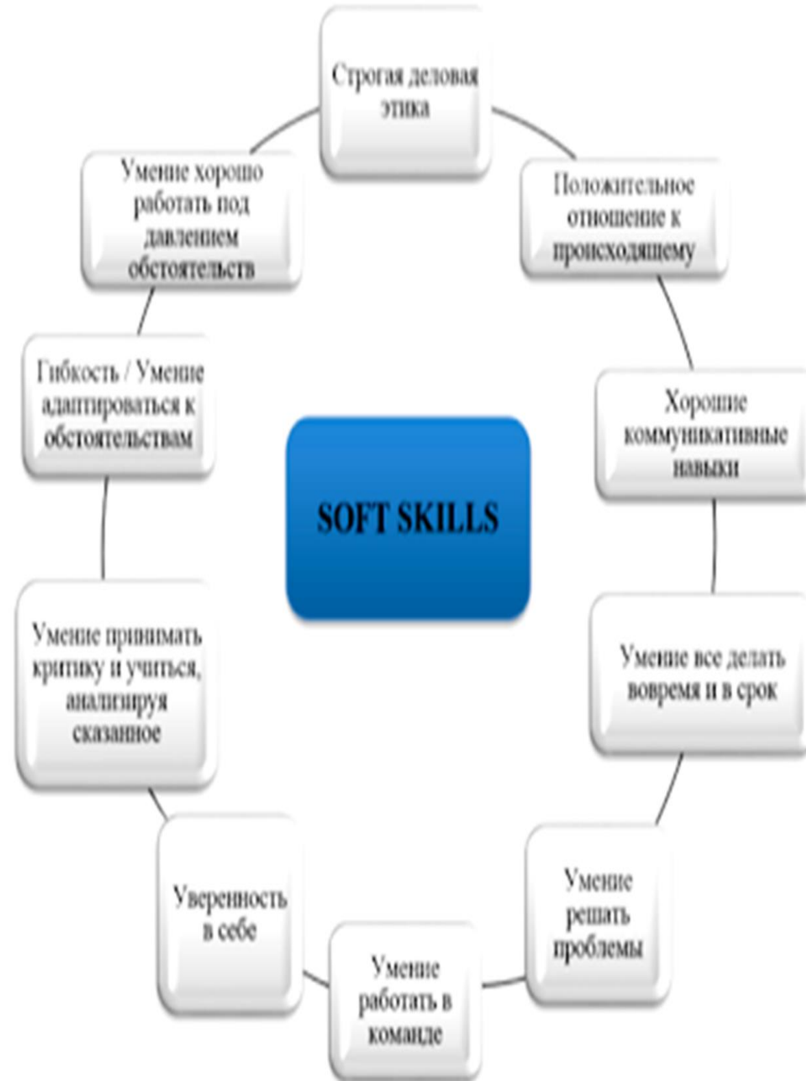
Рисунок 3. Составляющие понятия Soft skills (по Мамаевой С.)